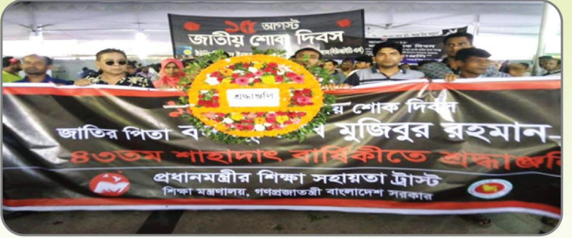
[জাতীয় শোক দিবস ও জাতির পিতা বঙ্গবন্ধু শেখ মুজিবুর রহমান এর ৪৩ তম শাহাদাৎ বার্ষিকী উপলক্ষে ধানমন্ডি ৩২ নম্বর রোডস্থ বঙ্গবন্ধুর প্রতিকৃতিতে প্রধানমন্ত্রীর শিক্ষা সহায়তা ট্রাস্ট এর পক্ষ থেকে পুষ্পস্তবক অর্পণ।]