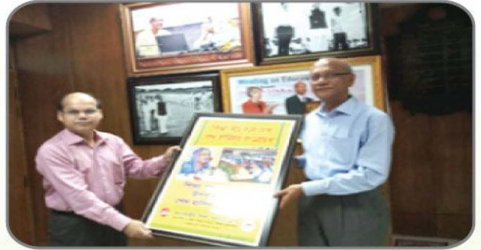
ট্রাস্ট কর্তৃক প্রকাশিত শিক্ষা বিষয়ক পোস্টার মাননীয় শিক্ষামন্ত্রী ও মাধ্যমিক ও উচ্চ শিক্ষা বিভাগের সচিব মহোদয়কে প্রদান করা হয়।