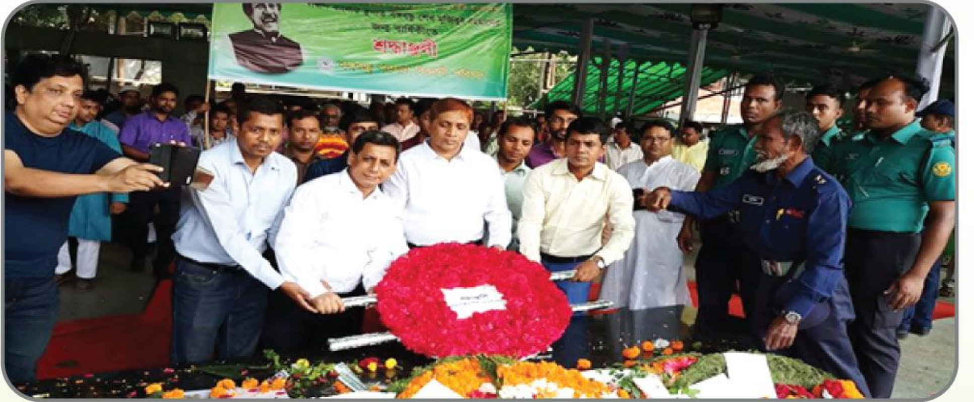
[জাতির পিতা বঙ্গবন্ধু শেখ মুজিবুর রহমান এর ৯৯ তম জন্মবার্ষিকী উপলক্ষে ধানমন্ডি ৩২ নম্বর রোডস্থ বঙ্গবন্ধুর প্রতিকৃতিতে প্রধানমন্ত্রীর শিক্ষা সহায়তা ট্রাস্ট এর পক্ষ থেকে পুষ্পস্তবক অর্পণ করা হয়।]

জাতির পিতা বঙ্গবন্ধু শেখ মুজিবুর রহমান এর ৯৯ তম জন্মদিন উদযাপন উপলক্ষে ১৭ মার্চ ২০১৯ খ্রি. তারিখে প্রধানমন্ত্রীর শিক্ষা সহায়তা ট্রাস্ট কর্তৃক গৃহীত কর্মসূচি অনুযায়ী সকাল ৭.৩০ মিনিটে ধানমন্ডি ৩২ নম্বর রোডস্থ জাতির পিতা বঙ্গবন্ধু শেখ মুজিবুর রহমান এর প্রতিকৃতিতে পুষ্পস্তবক অর্পণ করা হয়।