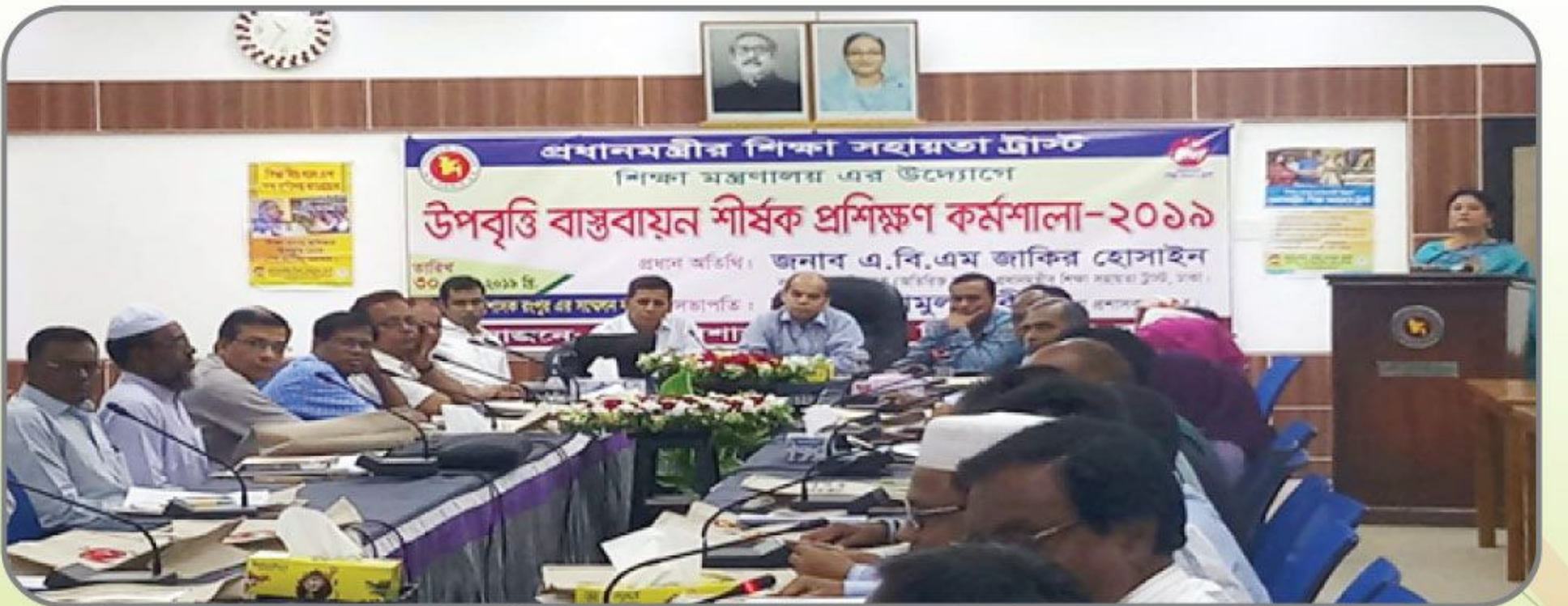
[৩০ মে ২০১৯ খ্রিস্টাব্দে রংপুর জেলা প্রশাসকের সম্মেলন কক্ষে উপবৃত্তি বাস্তবায়ন শীর্ষক প্রশিক্ষণ কর্মশালা অনুষ্ঠিত হয়।]