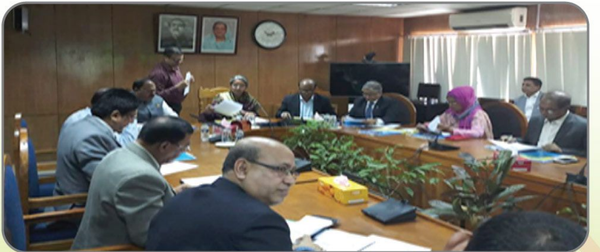
[মাননীয় শিক্ষামন্ত্রী ড. দীপু মনি এম.পি'র সভাপতিত্বে ২৪ ফেব্রুয়ারি ২০১৯ খ্রিস্টাব্দে শিক্ষা মন্ত্রণালয় এর সম্মেলন কক্ষে ট্রাস্টি বোর্ড এর নবম সভা অনুষ্ঠিত হয়।]