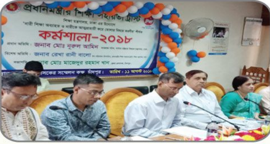
[১১ আগস্ট ২০১৮ খ্রিস্টাব্দের চাঁদপুর জেলা প্রশাসকের সম্মেলন কক্ষে 'নারী শিক্ষা অব্যাহত ও নারীকে আত্মপ্রত্যয়ী করে তোলার বিষয়ে করণীয়' শীর্ষক কর্মশালা অনুষ্ঠিত হয়।]