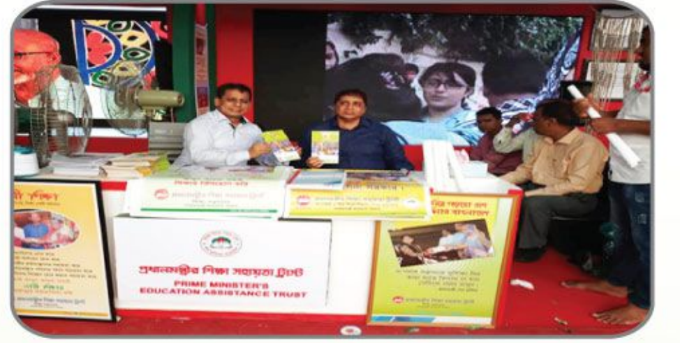
[৪ থেকে ৬ অক্টোবর ২০১৮ খ্রিস্টাব্দের অনুষ্ঠিত ৪র্থ জাতীয় উন্নয়ন মেলায় প্রধানমন্ত্রীর শিক্ষা সহায়তা ট্রাস্ট স্টল পরিদর্শন করেন পাবর্ত্য চট্টগ্রাম বিষয়ক মন্ত্রণালয়ের সচিব ও ট্রাস্টেও সাবেক ব্যবস্থাপনা পরিচালক মহোদয়।]