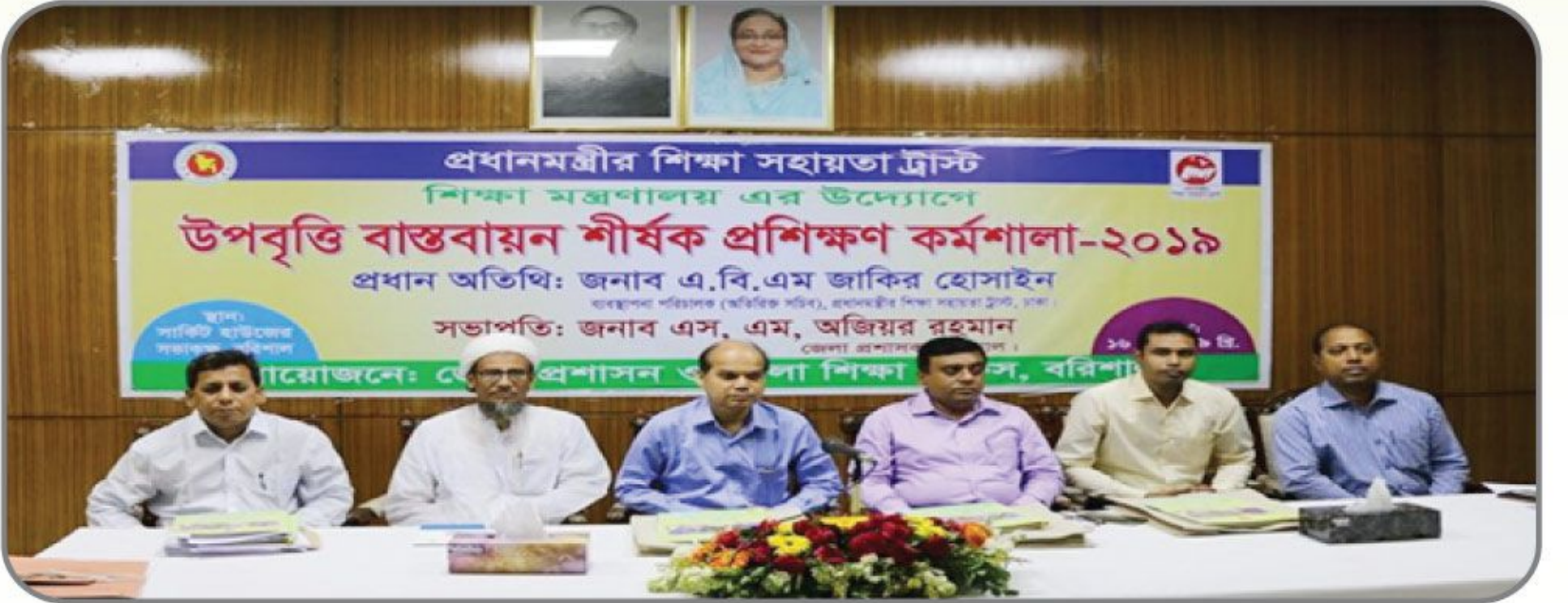
[১৬ মে ২০১৯ খ্রিস্টাব্দে বরিশাল সার্কিট হাউজের সম্মেলন কক্ষে উপবৃত্তি বাস্তবায়ন শীর্ষক প্রশিক্ষণ কর্মশালা অনুষ্ঠিত হয়।]