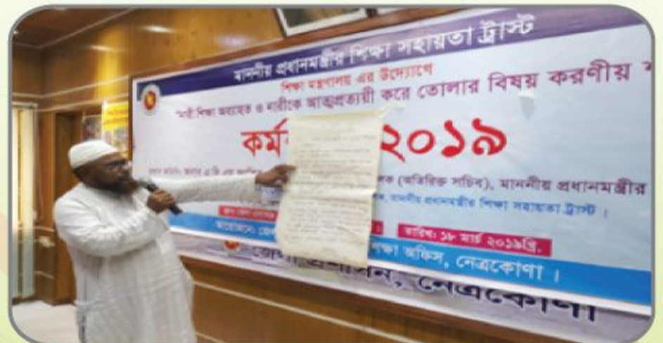
[নেত্রকোনা জেলা প্রশাসকের সম্মেলন কক্ষে অনুষ্ঠিত নারী শিক্ষা অব্যাহত ও নারীকে আত্মপ্রত্যয়ী করে তোলার বিষয়ে করণীয় শীর্ষক কর্মশালায় অংশগ্রহণকারী শিক্ষার্থী ও শিক্ষকের উপস্থাপনা।]