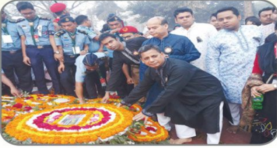
[২১ ফেব্রুয়ারি ২০১৯ খ্রিস্টাব্দের প্রভাতে শহীদ ব্যাধিতে প্রধানমন্ত্রীর শিক্ষা সহায়তা ট্রাস্টের পক্ষ থেকে শ্রদ্ধাঞ্জলি অর্পণ করা হয়।]