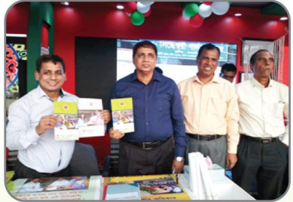
[৪ থেকে ৬ অক্টোবর ২০১৮ খ্রিস্টাব্দে অনুষ্ঠিত ৪র্থ জাতীয় উন্নয়ন মেলায় প্রধানমন্ত্রীর শিক্ষা সহায়তা ট্রাস্ট স্টলের খন্ডচিত্র।]