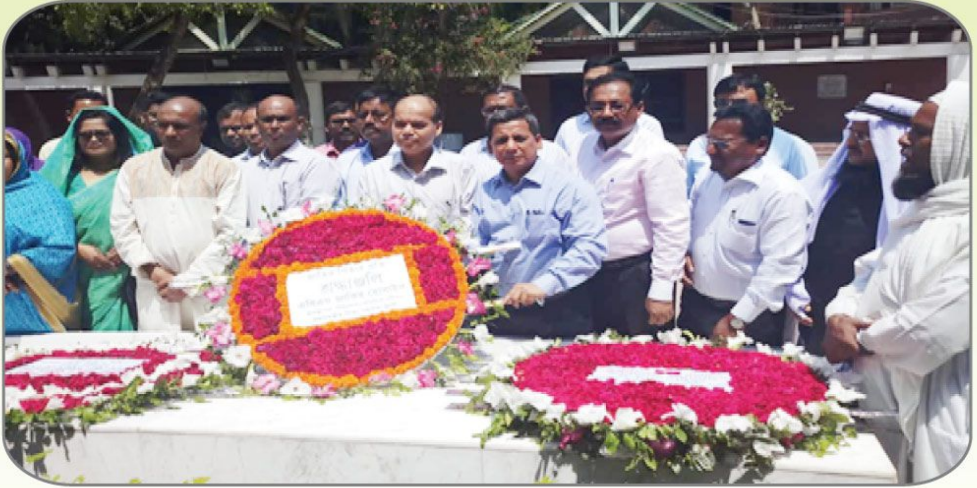
[প্রধানমন্ত্রীর শিক্ষা সহায়তা ট্রাস্টের পক্ষ থেকে জাতির পিতা বঙ্গবন্ধু শেখ মুজিবুর রহমানের সমাধিতে ২৮ মার্চ ২০১৯ খ্রিস্টাব্দে শ্রদ্ধাজলি প্রদান করা হয়।]