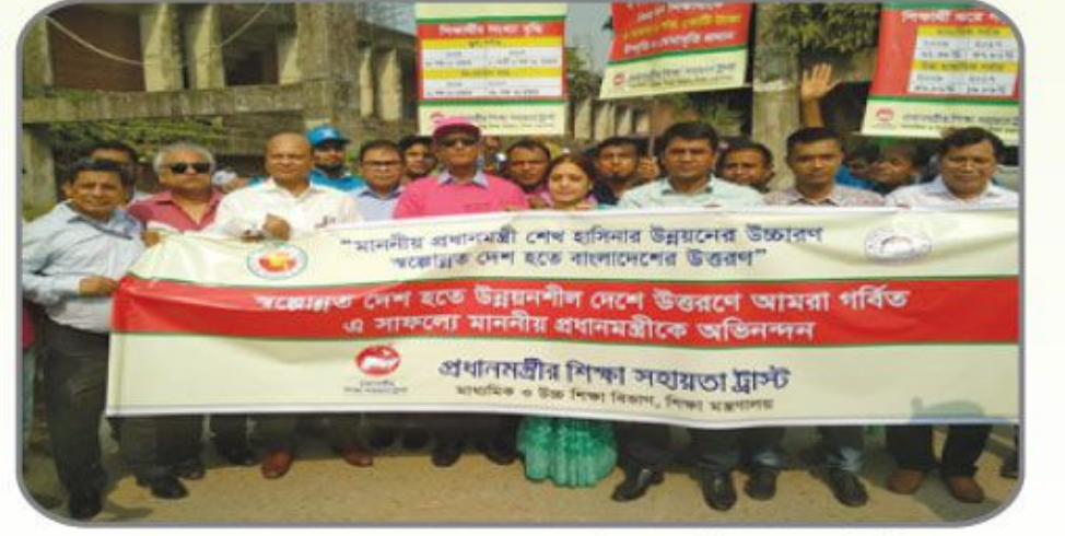
[বাংলাদেশ স্বল্পোন্নত দেশ হতে উন্নয়নশীল দেশে উন্নীত হওয়ায় মন্ত্রিপরিষদ বিভাগ আয়োজিত আনন্দ র্যালীতে প্রধানমন্ত্রীর শিক্ষা সহায়তা ট্রাস্ট এর পক্ষ থেকে অংশগ্রহণ।]