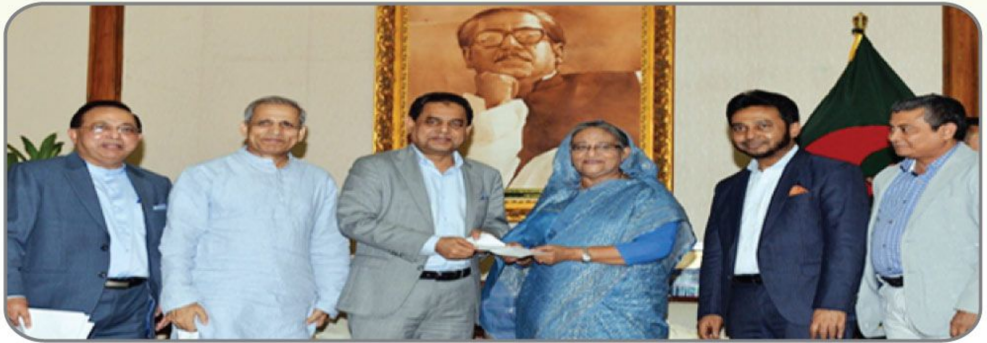
[প্রধানমন্ত্রীর শিক্ষা সহায়তা ট্রাস্ট তহবিলের জন্য গণভবনে ব্যবসায়ীগণ মাননীয় প্রধানমন্ত্রী শেখ হাসিনার নিকট অনুদানের চেক হস্তান্তর করেন।]