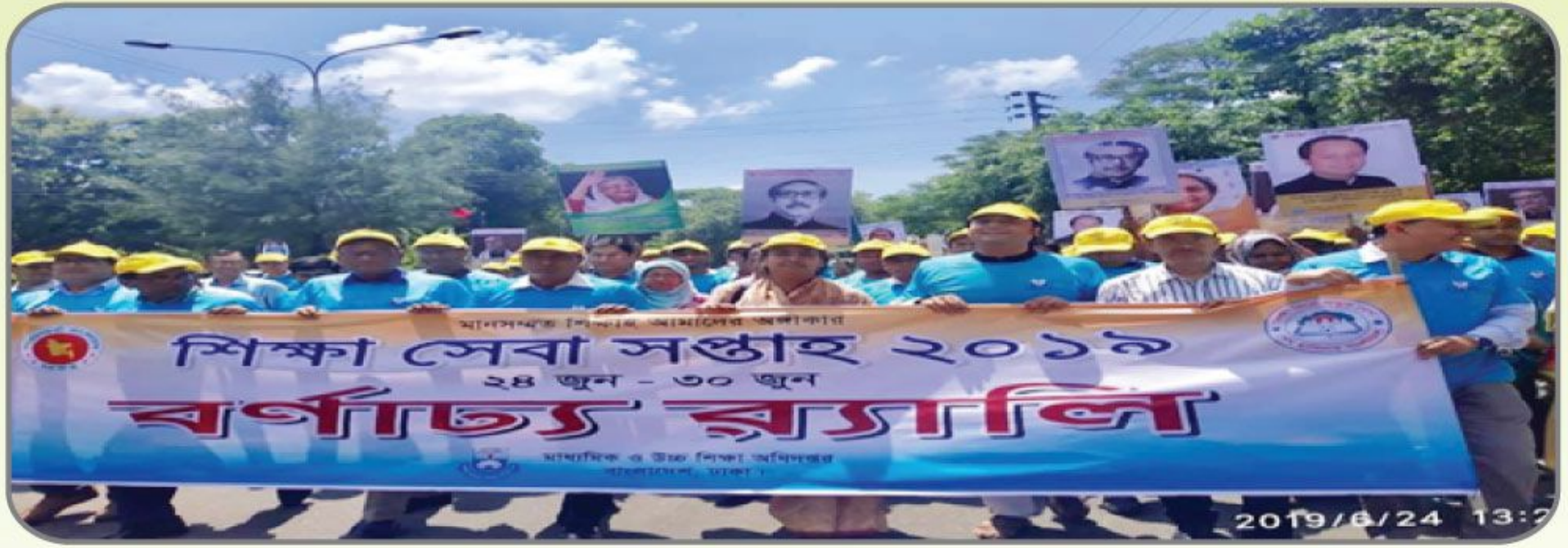
[শিক্ষা সেবা সপ্তাহ ২০১৯ এর বর্ণাঢ্য র্যালিতে প্রধানমন্ত্রীর শিক্ষা সহায়তা ট্রাস্টের অংশগ্রহণ।]