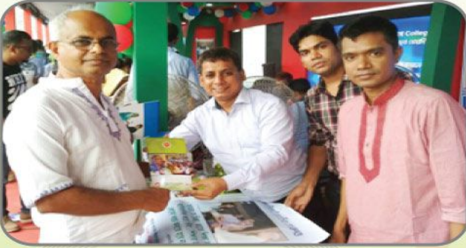
[৪ থেকে ৬ অক্টোবর ২০১৮ খ্রিস্টাব্দের অনুষ্ঠিত ৪র্থ জাতীয় উন্নয়ন মেলায় ট্রাস্টের স্টল পরিদর্শন করেন শিক্ষা মন্ত্রণালয়ের সাবেক সচিবদ্বয়।]