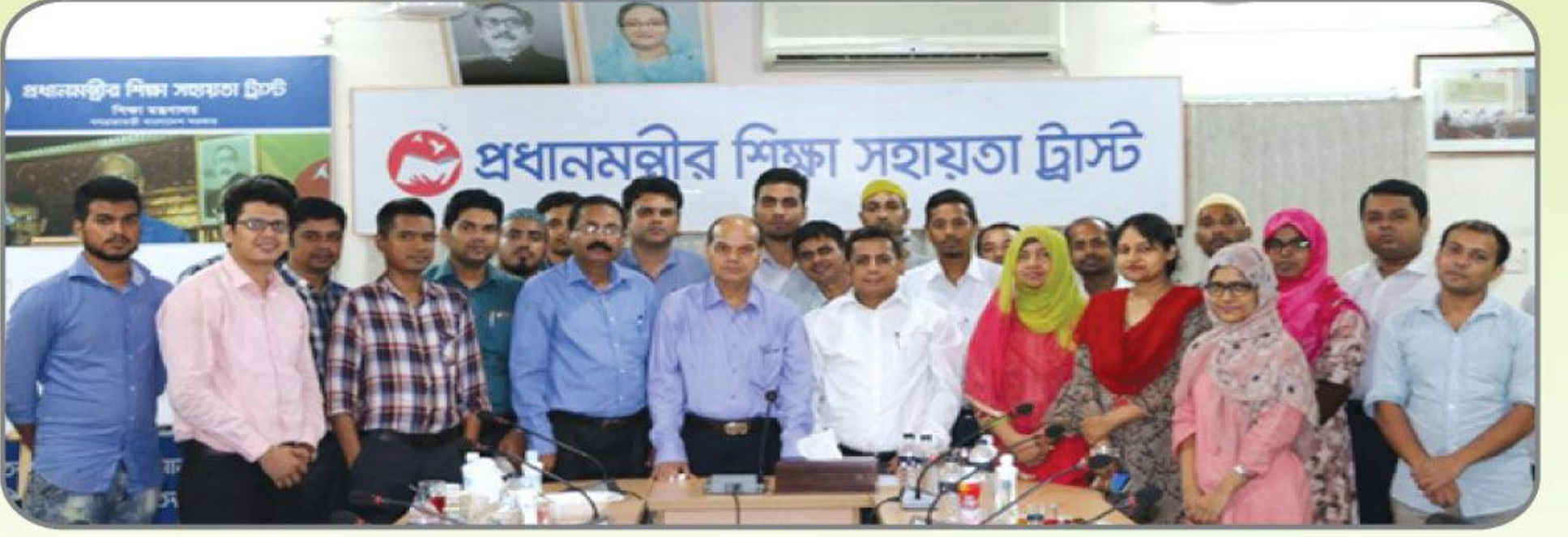
[অত্যন্তরীণ প্রশিক্ষণ শেষে ব্যবস্থাপনা পরিচালকের সাথে প্রধানমন্ত্রীর শিক্ষা সহায়তা ট্রাস্টের সকল কর্মকর্তা ও কর্মচারীগণ।]