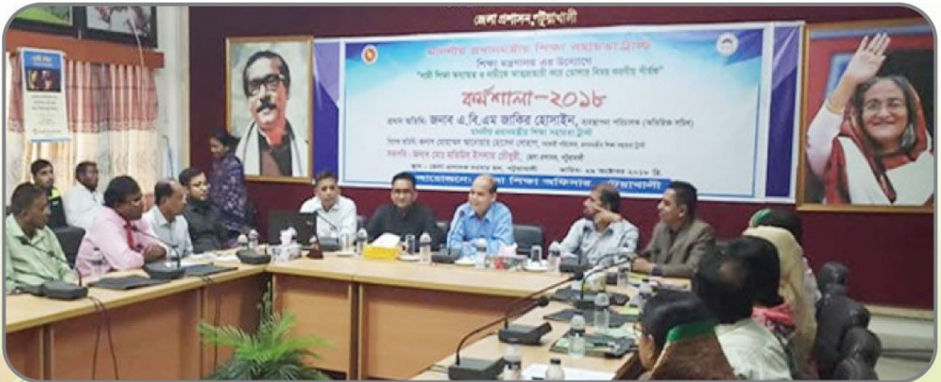
[২৯ অক্টোবর ২০১৮ খ্রিস্টাব্দে 'নারী শিক্ষা অব্যাহত ও নারীকে আত্মপ্রত্যয়ী করে তোলার বিষয়ে করণীয়' শীর্ষক কর্মশালা পটুয়াখালী জেলা প্রশাসকের সম্মেলন কক্ষে অনুষ্ঠিত হয়।]

প্রধানমন্ত্রীর শিক্ষা সহায়তা ট্রাস্ট এর উদ্যোগে 'নারী শিক্ষা অব্যাহত ও নারীকে আত্মপ্রত্যয়ী করে তোলার বিষয়ে করণীয়' শীর্ষক জেলা পর্যায়ে ১০ টি কর্মশালা আয়োজন করা হয় যার বিস্তারিত বিবরণ নিম্নরূপ: