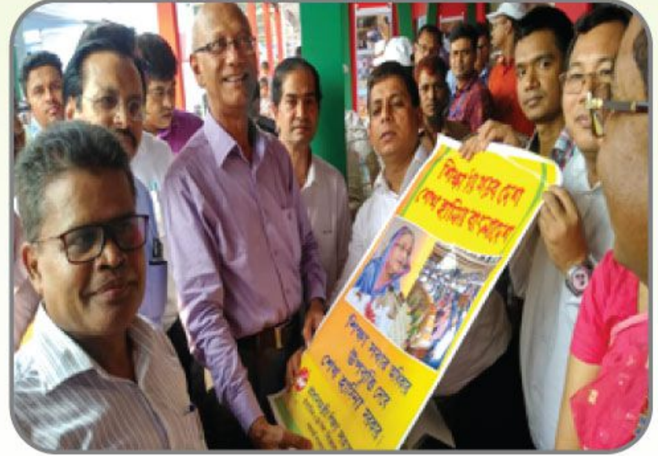
[৪ থেকে ৬ অক্টোবর ২০১৮ খ্রিস্টাব্দে অনুষ্ঠিত ৪র্থ জাতীয় উন্নয়ন মেলায় প্রধানমন্ত্রীর শিক্ষা সহায়তা ট্রাস্ট স্টলের খন্ডচিত্র।]