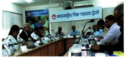
চিত্র: প্রধানমন্ত্রীর শিক্ষা সহায়তা ট্রাস্ট এর সম্মেলন কক্ষে ৩ আগস্ট ২০১৭ তারিখে অনুষ্ঠিত ট্রাস্টি বোর্ডের ষষ্ঠ সভা

মাননীয় মন্ত্রী, শিক্ষা মন্ত্রণালয় এর সভাপতিত্বে গত ০২/০৫/২০১৩ তারিখে শিক্ষা মন্ত্রণালয়ে ট্রাস্টি বোর্ডের প্রথম সভা, ১১/০৬/২০১৪ তারিখে প্রধানমন্ত্রীর শিক্ষা সহায়তা ট্রাস্ট এর সম্মেলন কক্ষে দ্বিতীয় সভা অনুষ্ঠিত হয়। ট্রাস্টি বোর্ড তৃতীয় সভা ১২/০১/২০১৫ তারিখে মাননীয় মন্ত্রী, শিক্ষা মন্ত্রণালয় এর সভাপতিত্বে শিক্ষা মন্ত্রণালয়ে এবং চতুর্থ সভা ১২/১০/২০১৫ তারিখে মাননীয় মন্ত্রী, শিক্ষা মন্ত্রণালয় এর সভাপতিত্বে প্রধানমন্ত্রীর শিক্ষা সহায়তা ট্রাস্ট এর সম্মেলন কক্ষে অনুষ্ঠিত হয়। ট্রাস্টি বোর্ড পঞ্চম সভা ২৭/০৯/২০১৬ তারিখে এবং ৩/০৮/২০১৭ তারিখে ষষ্ঠ সভা মাননীয় মন্ত্রী, শিক্ষা মন্ত্রণালয় এর সভাপতিত্বে প্রধানমন্ত্রীর শিক্ষা সহায়তা ট্রাস্টের সম্মেলন কক্ষে অনুষ্ঠিত হয়।