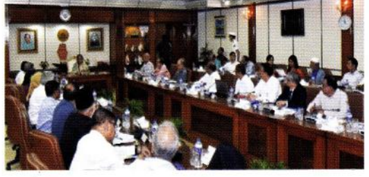
চিত্র: ২৩ এপ্রিল, ২০১৭ তারিখে মাননীয় প্রধানমন্ত্রী শেখ হাসিনা এর সভাপতিত্বে ট্রাস্ট এর উপদেষ্টা পরিষদের ৪র্থ সভা

মাননীয় প্রধানমন্ত্রীর সভাপতিত্বে গত ১৩/০৩/২০১৩ তারিখে প্রধানমন্ত্রীর কার্যালয়ে ট্রাস্ট এর উপদেষ্টা পরিষদের প্রথম, ০৫/০৪/২০১৫ তারিখে ২য়, ২০/০৪/২০১৬ তারিখে তৃতীয় এবং ২৩/০৪/২০১৭ তারিখে ৪র্থ সভা অনুষ্ঠিত হয়।