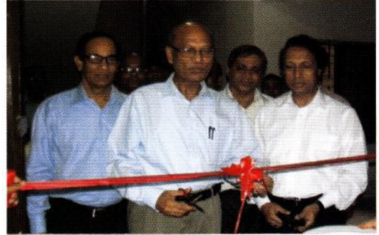
প্রধানমন্ত্রীর শিক্ষা সহায়তা ট্রাস্ট এর অফিস উদ্বোধন