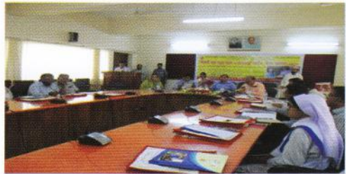
২৯ মে, ২০১৫ তারিখে গোপালগঞ্জ জেলা প্রশাসকের সম্মেলন কক্ষে অনুষ্ঠিত 'বরে পড়া রোধে করণীয়' শীর্ষক কর্মশালা

প্রধানমন্ত্রীর শিক্ষা সহায়তা ট্রাস্ট থেকে শিক্ষার্থী বারে পড়ার কারণ ও তা রোধকল্পে করণীয় নির্ধারণের জন্যে ৩০টি জেলায় কর্মশালার আয়োজন করা হয়।