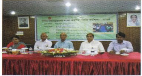
১৩ মে, ২০১৫ তারিখে ঢাকা বিভাগে অনুষ্ঠিত শিক্ষার মানোন্নয়নে করণীয় শীর্ষক কর্মশালা

৭টি বিভাগে 'শিক্ষার মানোন্নয়ন বিষয়ক' কর্মশালা আয়োজন করা হয়েছে। বিভাগীয় পর্যায়ে আয়োজিত কর্মশালা থেকে প্রাপ্ত সুপারিশসমূহ প্রধানমন্ত্রীর কার্যালয় ও শিক্ষা মন্ত্রণালয়সহ সংশ্লিষ্ট দপ্তরসমূহে প্রয়োজনীয় ব্যবস্থা গ্রহণের জন্য প্রেরণ করা হয়েছে এবং প্রতিবেদন আকারে প্রকাশ করা হয়েছে।