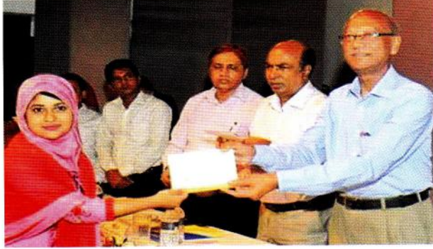
১৩ জুলাই ২০১৭ খ্রিস্টাব্দে আন্তর্জাতিক মাতৃভাষা ইনস্টিটিউটে অনুষ্ঠিত অনুষ্ঠানে প্রধান অতিথি হিসেবে উপবৃত্তির চেক বিতরণ করছেন মাননীয় শিক্ষামন্ত্রী জনাব নুরুল ইসলাম নাহিদ এম.পি.