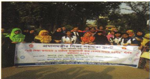
চিত্র: কুমিল্লার সার্কিট হাউস এ ১৭ ফেব্রুয়ারি ২০১৭ তারিখে অনুষ্ঠিত কর্মশালায় অংশগ্রহণকারী নারীদের একাংশ

২৭টি জেলায় 'নারী শিক্ষা অব্যাহত এবং নারীকে আত্মপ্রত্যয়ী করে তোলার বিষয়ে করণীয়' শীর্ষক কর্মশালা ২৭টি জেলায় আয়োজন করা হয়েছে। জেলা পর্যায়ে আয়োজিত কর্মশালা থেকে প্রাপ্ত সমন্বিত সুপারিশসমূহ শিক্ষা মন্ত্রণালয়ে প্রয়োজনীয় ব্যবস্থা গ্রহণের জন্য প্রেরণ এবং বই আকারে প্রতিবেদন প্রকাশ করা হয়েছে।