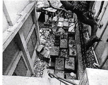
সারিবদ্ধ জরাজীর্ণ ট্রাঙ্ক