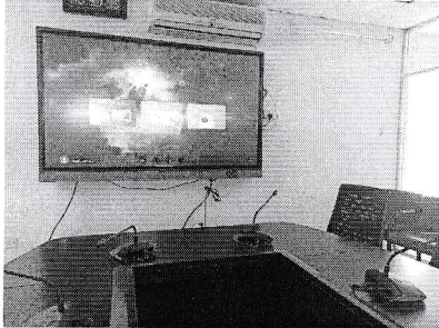
সম্মেলন কক্ষে ডিজিটাল মনিটর স্থাপন

০৩। প্রধানমন্ত্রীর শিক্ষা সহায়তা ট্রাস্ট অফিসে উন্নত কর্ম-পরিবেশ বাস্তবায়নের লক্ষ্যে ট্রাস্টের সম্মেলন কক্ষে অবস্থিত পুরাতন আসবাবপত্র পরিবর্তন করে নতুন আসবাবপত্র স্থাপন করা হয়। সেই সাথে সম্মেলন কক্ষে দীর্ঘদিন ব্যবহৃত পুরাতন স্ক্রিন প্রোজেক্টর পরিবর্তন করে নতুন ডিজিটাল ভিডিও কনফারেন্সিং সিস্টেম স্থাপন করা হয়েছে।